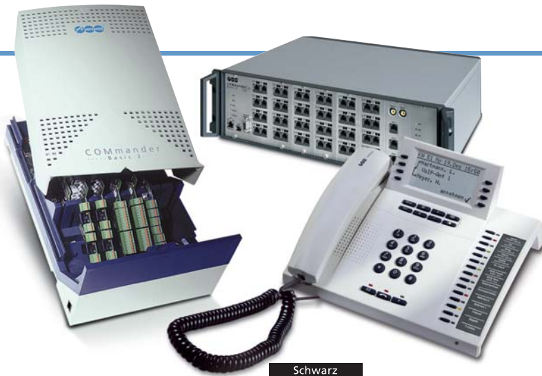
Schwarz Lichtgrau (weiß) Dunkelblau Die COMfortel-Systemtelefone stehen in diesen 3 Farben zur Verfügung.